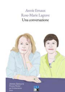
L'ouvrage "Une conversation" entre