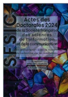
Les actes des Doctorales de la